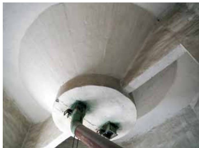
Spodný pohľad na „polovičnú bunku“ určenú ako zásobník na kalibrát, t. j. na zlomky získané v procese čistenia zrnín.

lia pozostáva z 21 šesťbokých komôr so svetlým priemerom 6 m, usporiadaných v troch radoch po sedem vedľa seba. Dopĺňajú ich dve výdajové štvrtbunky. V dvoch priľahlých šesťuholníkových ko-