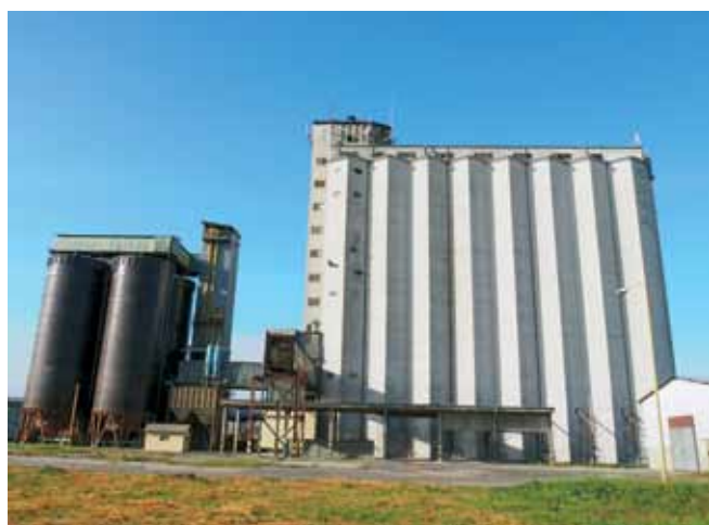
Pohľad od železnice na veľkokapacitné železobetónové obilné silo RWA Podunajské Biskupice (1976 - 1977), vľavo sú v roku 1987 dostavané ocelové zásobníky.

Vlastné silo tvorí železobetónový monolitický korpus. Časť pre uskladnenie obi-