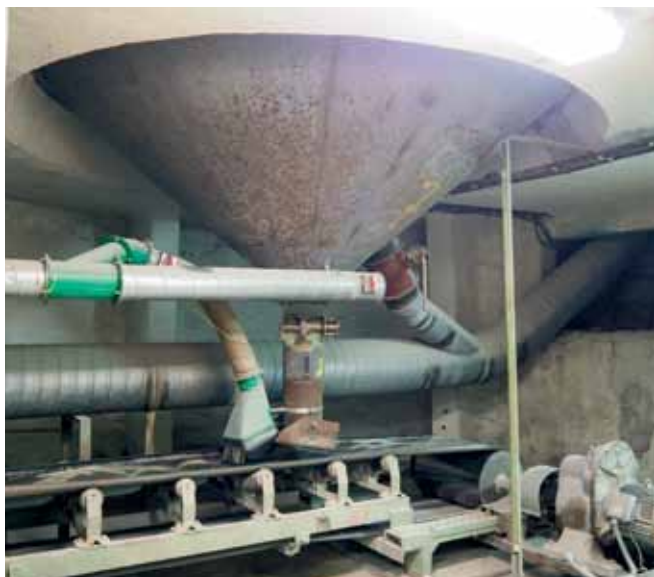
Pohľad do interiéru sila v suteréne. Dná buniek s výpusťami, vyskladňovacími pásmi a aspiračným potrubím.