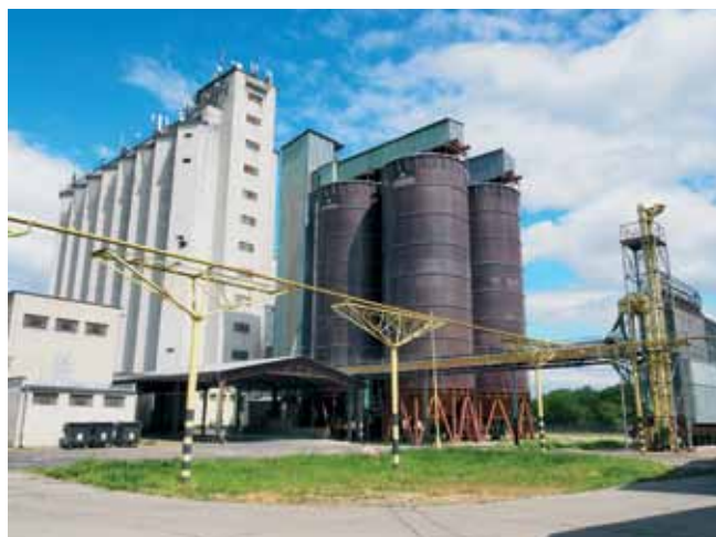
Pohľad na sústavu síl z juhu, v popredí nadzemný plynový potrubný most sušičky uložený na ocelovej konštrukcii.