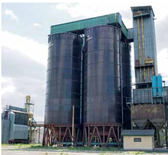
K silu bola pristavaná skupina ocelových síl VŽKG.

Technologické zázemie tvorí na dvadsiatich poschodiach vyústenie piatich korčkových elevátorov, ktoré vynášajú obilie z prízemnia do kruhových rozdeľovačov, schopných tovar transportovať do viac ako troch smerov, s následným naskladnením pomocou vozíkov na dvoch dopravných pásoch pod strechou (11. poschodie) do silových buniek. Kapacita je 65 ton za hod. Na šiestom poschodí sú umiestnené dve čističky - typ ASP-750 v kombinácii s vibračnou čističkou. Odstránené organické a anorganické nečistoty (zlomky, cudzie semená, prímese, prach) sú zhromažďované do polovičnej silovej bunky situovanej v podlažných priestoroch strojovne. Horizontálny transport obilia prebieha po