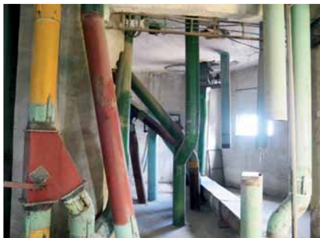
Ukážka zložitých dopravných ciest obilného sila.