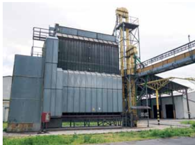
Sušička obilia typu MC (MATHEWS Company) model – 975 so samostatne stojacim ovládacím panelom.