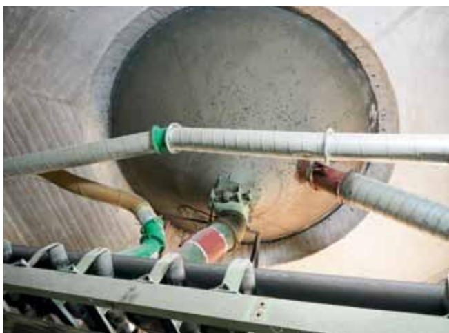
Spodný pohľad na zakončenie hlbínnej bunky sila zo suterénu s výpusťami.