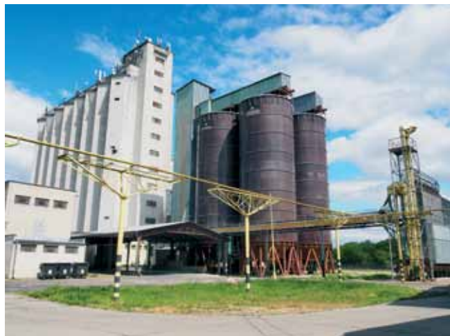
Pohľad na sústavu síl z juhu, v popredí nadzemný plynový potrubný most sušičky uložený na ocelovej konštrukcii.