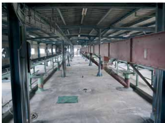
Interiér posledného poschodia s pásovými dopravníkmi pre nakladňovanie do buniek.