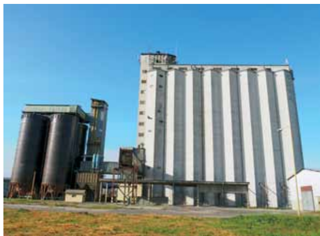
Pohľad od železnice na veľkokapacitné železobetónové obilné silo RWA Podunajské Biskupice (1976 - 1977), vľavo sú v roku 1987 dostavané ocelové zásobníky.

Vlastné silo tvorí železobetónový monolitický korpus. Časť pre uskladnenie obi-