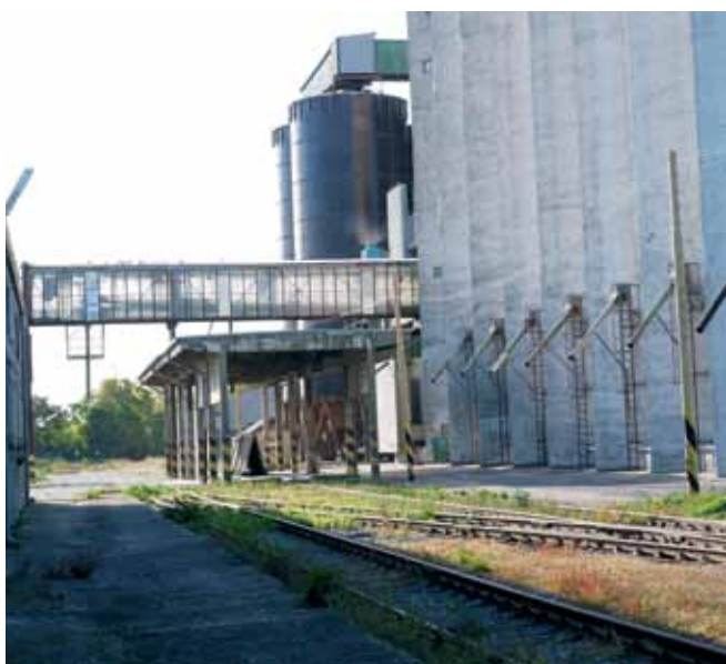
Časť obilného sila so železničnou vlečkou, košmi a prístreškom pre krytú váhu na vážnie vagónov, vpravo sú bočné výpuste, tzv. silosi, na vyskladňovanie zrnín samospádom.