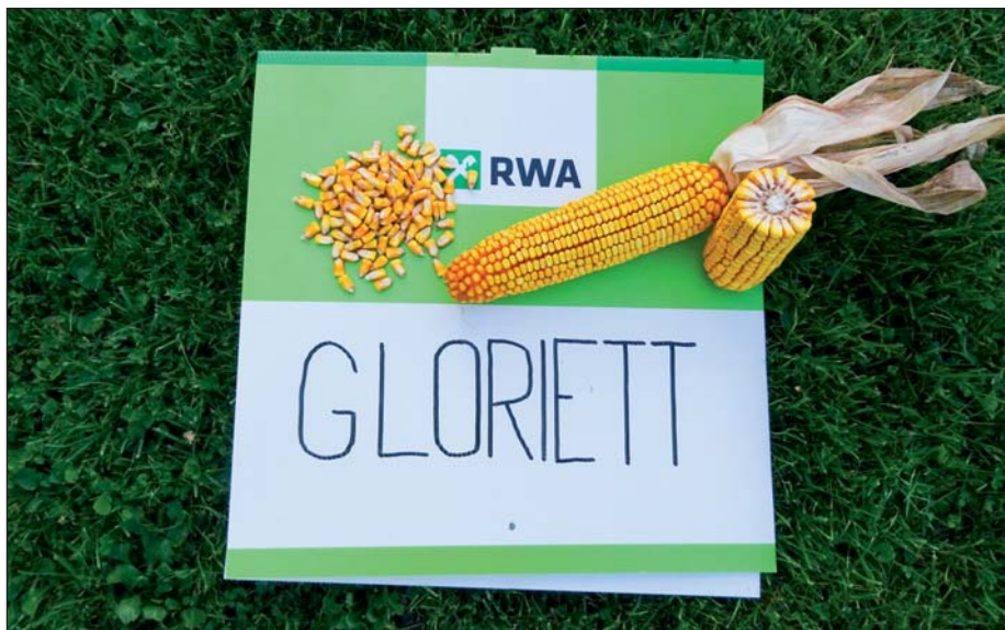
Hybrid GloriETT tvorí pravidelné čisté šúľky s kompletným opelením. Zrno je ploché s výrazným typom konský zub , veľmi dobre uvoľňuje vodu. Lokalita : Zavar, r. 2019

Uvedené novinky dopĺňajú náš sortiment hybridov v strednom a stredne neskorom skorostnom segmente. Spoločne s ďalšími zrnovými hybridmi značky G-SEED sú určené predovšet-