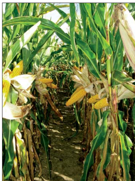
Pevné steblo hybridu GloriETT nemá tendenciu k políhaniu, resp. k lámaniu počas celej vegetácie. Lokalita : Zavar, r. 2019

Výnimočná pevnosť stebľa aj v závere vegetácie Hybrid GLORIETT upúta pozornosť už na začiatku vegetácie vysokou energiou počiatového rastu. Stredne vysoké rastliny sa vyznačujú extrémne pevným stebľom. Skvelé úrodové parametre potvrdil v skúškach v regióne strednej