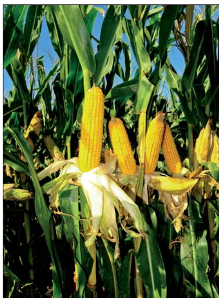
Zdravé a plne opelené klasy tvorí hybrid Persic aj porastoch s vyššou hustotou rastlín. Lokalita : Komoča, r. 2019