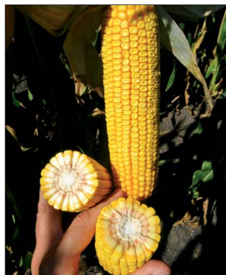
Hybrid Tweetor tvorí typické hrubé (22 radov) valcovité šúľky s výrazným Dry down efektom, ktorý posúva jeho zberové vlhkosti na úroveň stredne skorých hybridov. Lokalita : Komoča, r. 2019