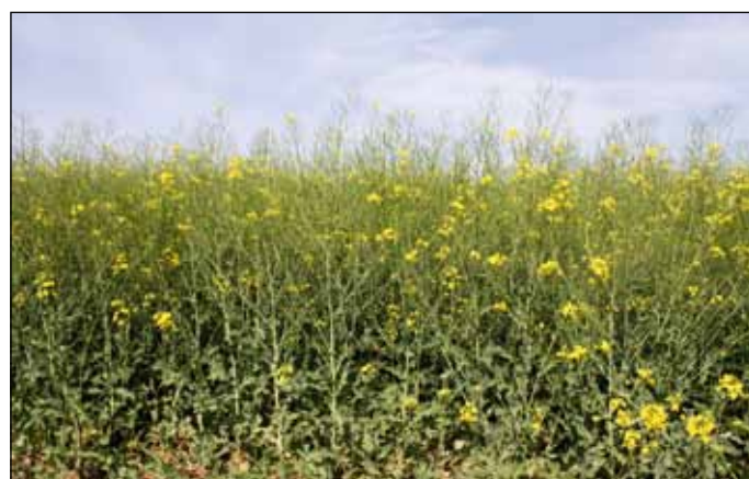
Anniston vo fáze odkvitania, 3.5.2018, lokalita Borovce.

hostiteľských rastlín) pozitívne vplyvávajú na rozvoj tohto vírusového ochorenia. Pri našej hybridnej repke ANNISTON máte tieto faktory vyriešené!